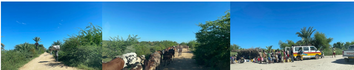
Scènes de nos trajets quotidiens entre le Famata Lodge et la clinique à Tuléar