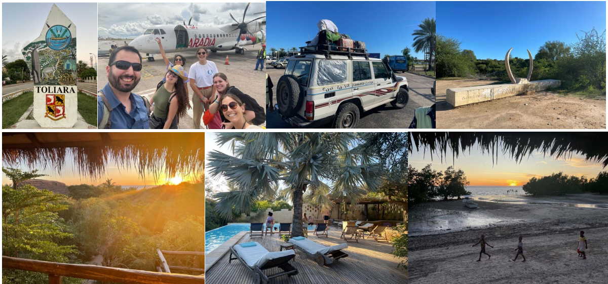
*Arrivée à Tuléar, Tropique du Capricorne et Famata Lodge

Le groupe au complet décolle vers le sud dans l'après-midi. Tuléar et ses 30-35° nous attendent. L'annonce de notre arrivée se répand rapidement via les réseaux sociaux locaux et génère beaucoup d'intérêt. Notre camp de base, le Famata Lodge, se trouve à 30mn au sud de la ville, sur le tropique du Capricorne que nous traverserons tous les jours.