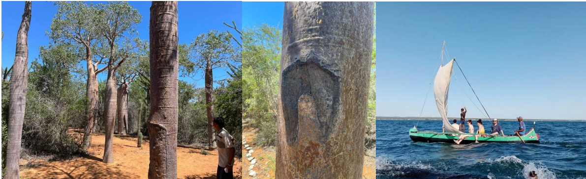
*Réserve Reniala & pirogue le long des côtes à Ifaty

Samedi 25/3 - Nous parlerons d'une journée de détente mentale plus que de repos physique, mais se promener à travers de majestueux baobabs, puis glisser sur les eaux de la côte malgache en pirogue pour profiter d'une des plus grande barrière de corail au monde, cela a ravi l'équipe, revigorée pour attaquer nos 2 derniers jours cliniques. On s'y remet dès demain !